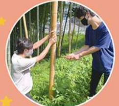
竹は毎年ご近所の「こどもの杜」 さまよりいただいています。